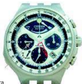
Стрелка счётчика часов Хронографа

Примечание: Отсчёт времени хронографа автоматически прекращается по истечении 12 часов. Вы должны будете нажать и отпустить нижнюю правую кнопку, чтобы переустановить стрелки на «старт» или «нулевую позицию».