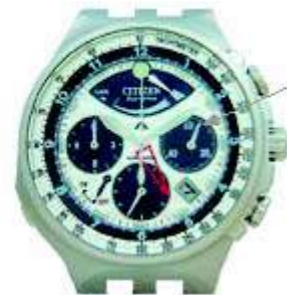
Стрелка счётчика минут Хронографа

Хронограф активируется, если сильно нажать и отпустить верхнюю правую кнопку. Хронограф можно остановить, если сильно нажать и отпустить верхнюю правую кнопку ещё раз. Для сброса хронографа после окончания отсчёта времени необходимо сильно нажать и отпустить нижнюю правую кнопку.