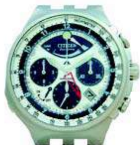
Верхняя правая кнопка

Данная модель представляет 12-часовой хронограф, который отмеряет время по 1/5 секунды.